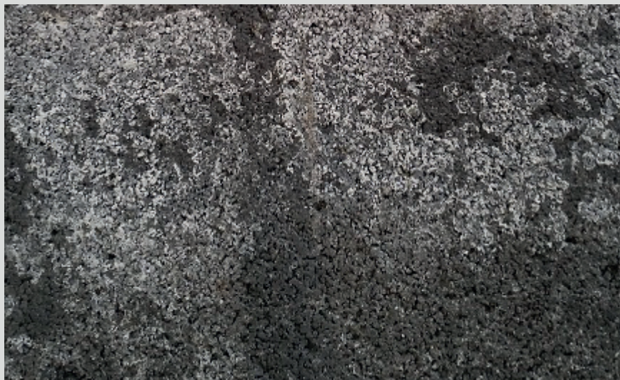
Wasserdurchlässiger Stein ohne Maleki-SlagSil