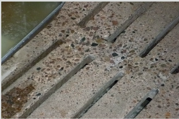
Spaltboden ohne Maleki-SlagSil

Die Maleki GmbH versteht sich hier als Dienstleister für die Einstellung und Optimierung Ihrer Formulierung. Zusätzlich zur einfachen Reduktion von Portlandzement können auch gezielt bestimmte Eigenschaften optimiert werden.