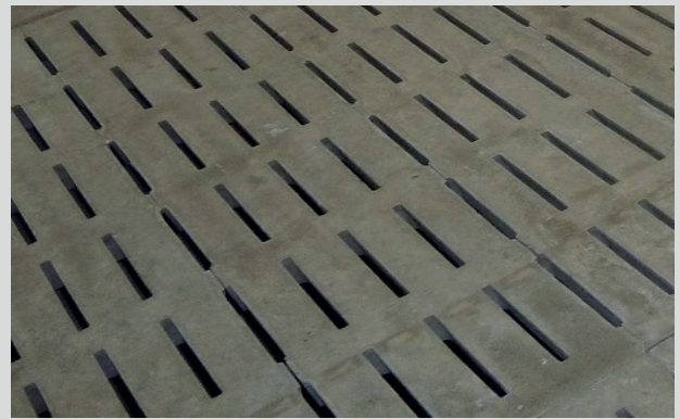
Spaltenboden mit Maleki-SlagSil

H&Z Bausysteme AG Grindelstrasse 5, 8304 Wallisellen