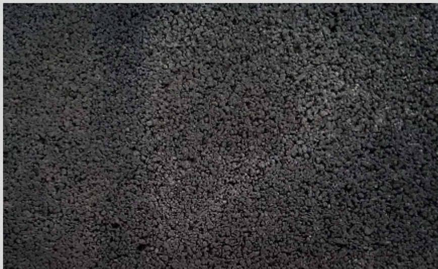
Wasserdurchlässiger Stein mit Maleki-SlagSil

System für ausblühungsfreie und salzwasserbeständige Betonbauteile